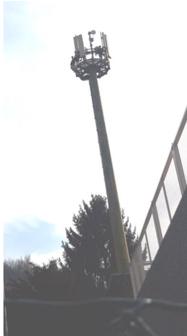
Figura 1: Impianti di Via Cave - Albino (BG).

Le misure a banda larga sono state effettuate così come previsto dalle Norme CEI 211-7 del 2001, CEI 211-10 del 2002 e CEI 211-7/E del 2014, in particolare installando lo strumento su cavalletto isolante e con il sensore di misura a 1,5 metri dal suolo.